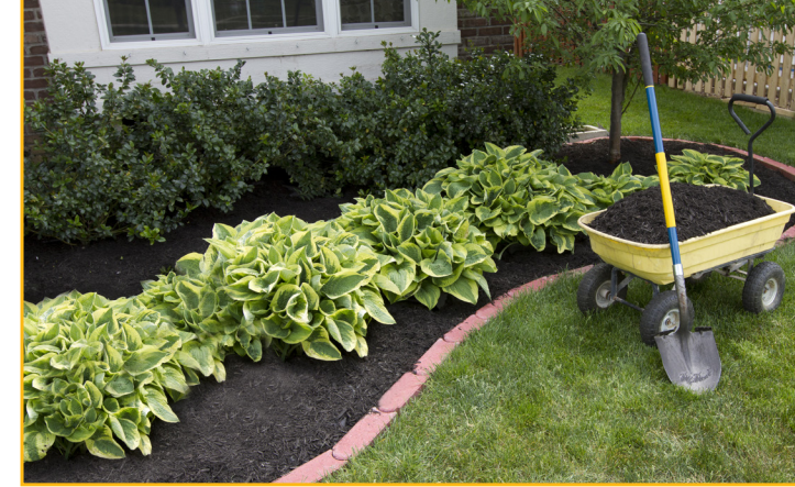
Colocación de una cobertura permanente como un área verde y cubierta retenedora de humedad o mantillo orgánico.

Asegúrese de que el suelo y las superficies de jardines y áreas verdes permanezcan por debajo de la banqueta o borde de la banqueta para ayudar a contener la erosión y evitar que llegue a la banqueta o la calle.