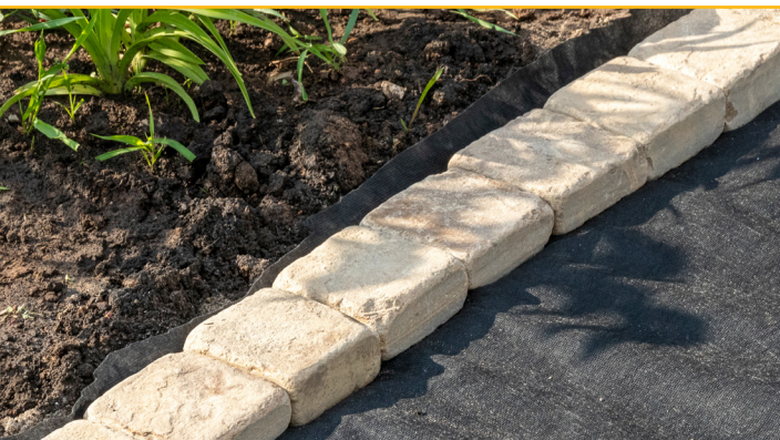
La cubierta retenedora de humedad o mantillo orgánico ayuda a prevenir la erosión del suelo.

Consulte la última página de este folleto para conocer las formas de controlar la erosión del suelo hasta lograr una estabilización permanente. Una vez que la vegetación esté colocada, retire cualquier medida de control de la erosión del suelo a corto plazo.