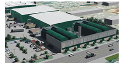
Centro de digestión anaeróbica de EDCO

El desperdicio de materiales orgánicos de tu contenedor verde terminará en un centro de desviación, de compostaje o de digestión anaeróbica. En estos procesos naturales, microorganismos degradan la materia orgánica, la cual será reciclada para producir gas natural renovable y enmiendas para el suelo.